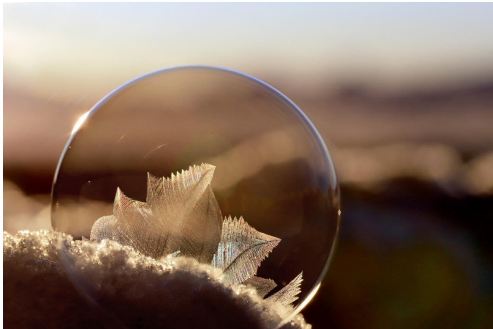
Prix de la Créativité : Mémoire éphémère d'un Phylactère n°2 de Christian Dupont Objectif 100 macro - 800 iso f 14 1/500 s