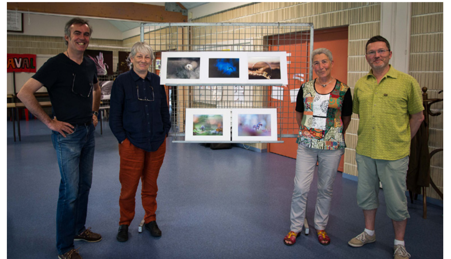
La commissaire du concours et les juges autour des photographies couleurs primées