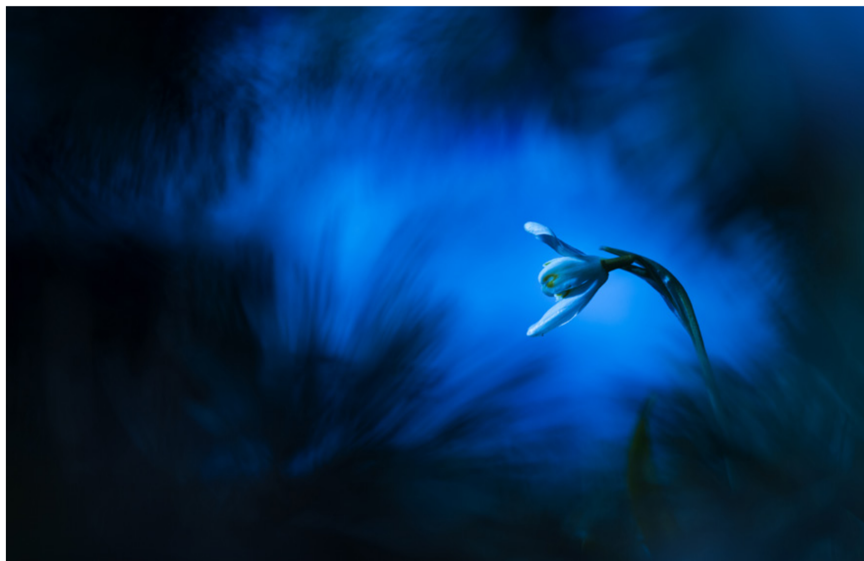
Coup de coeur du juge David Commenchal - Blue de Gaël Bastard EOS 6D Mark II - Objectif 100 macro 100 iso f 6,3 1/400 s