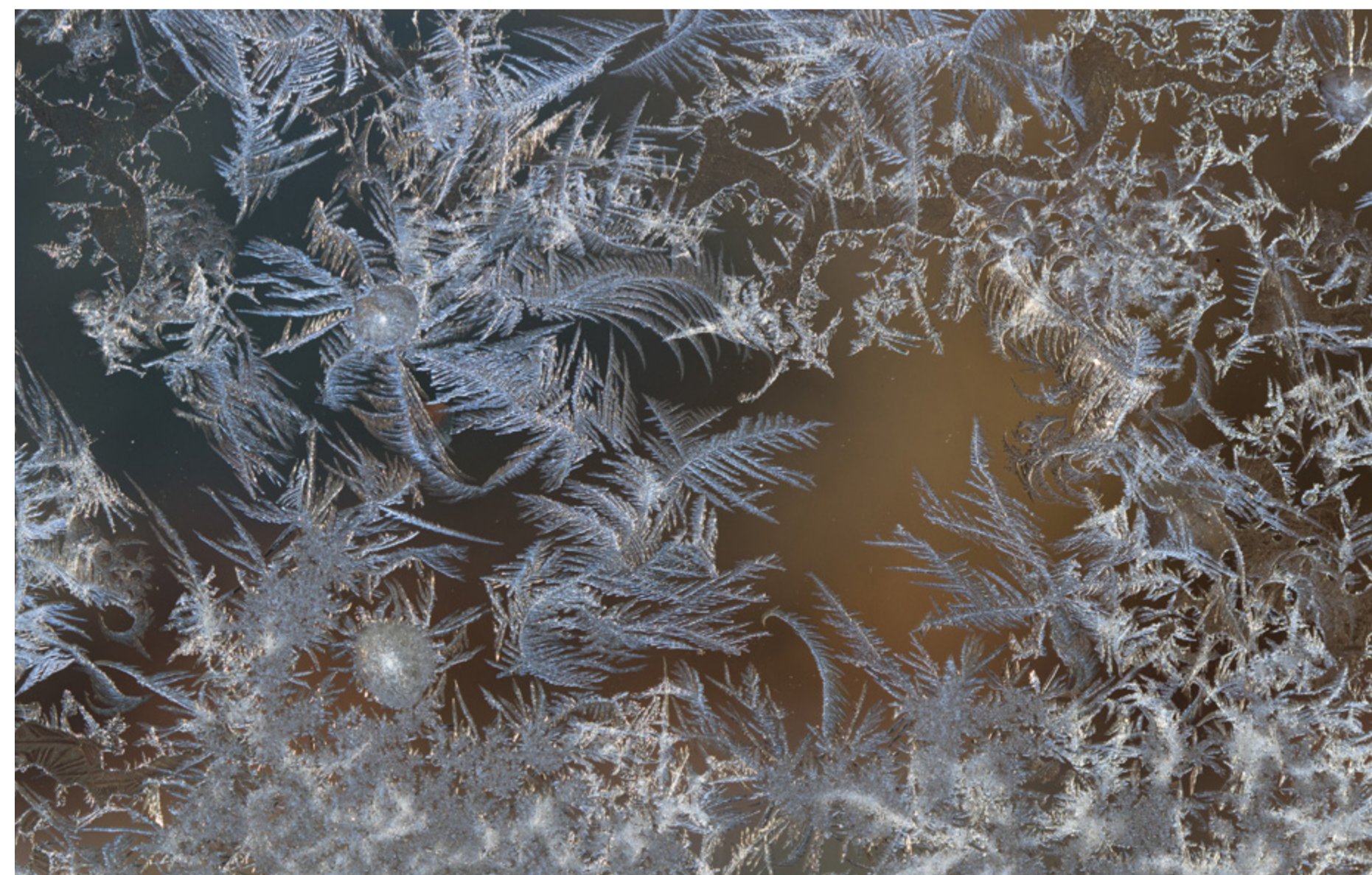
Constellation givrée de Gaël Bastard - EOS 80D 100 macro 200 iso f 6,3 1/125 s