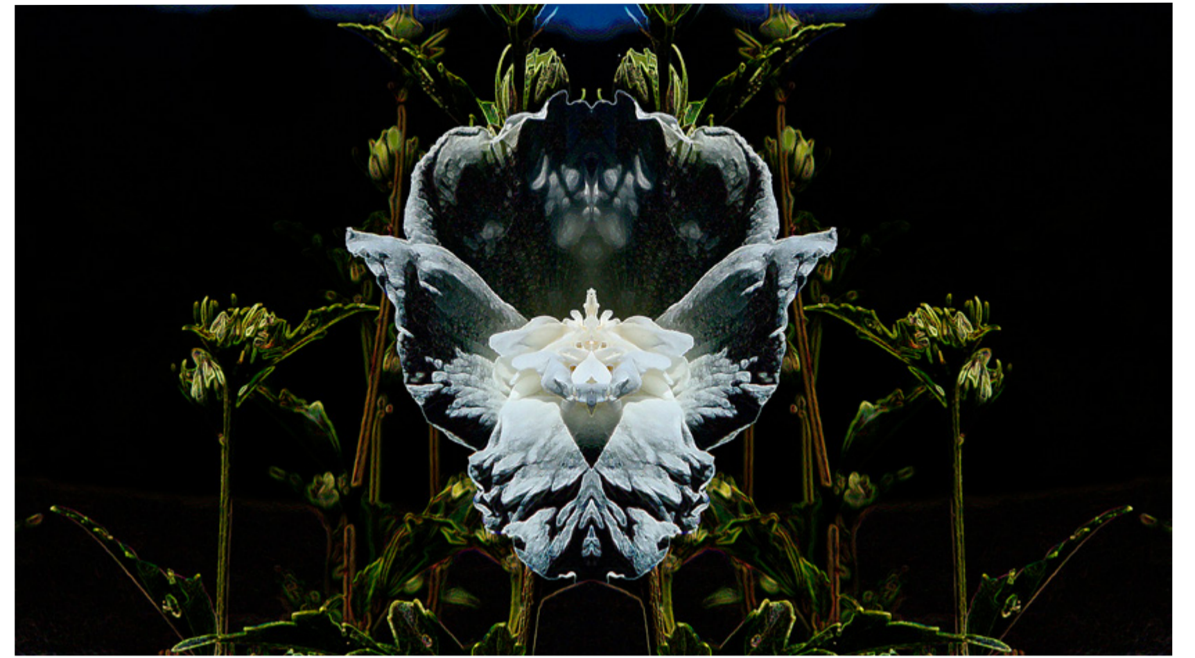
Le trône - Benedict Savary

A l'origine du cygne, des pétales de tulipe.