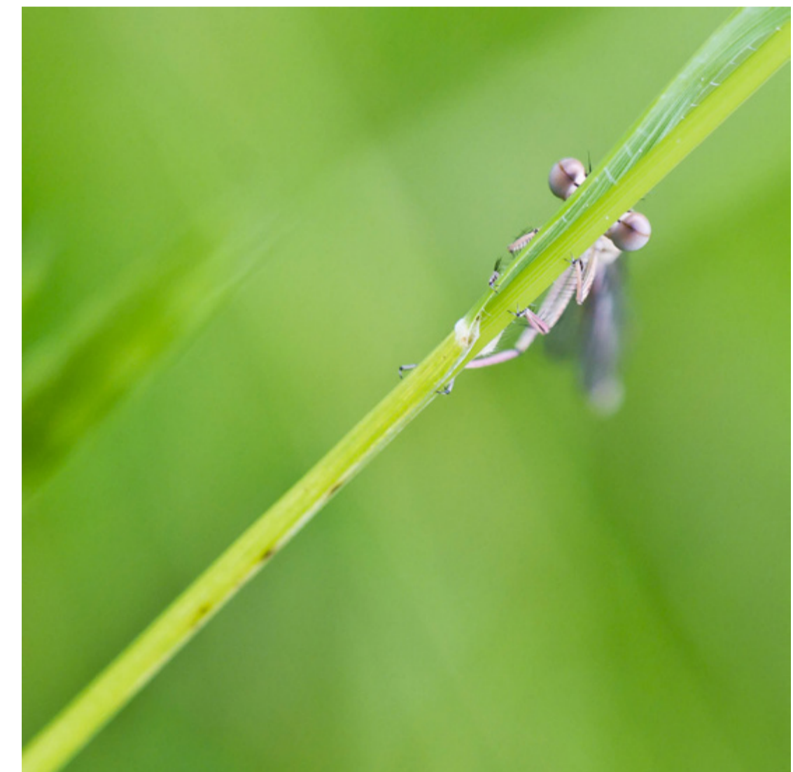
Cache cache de Franck Royer