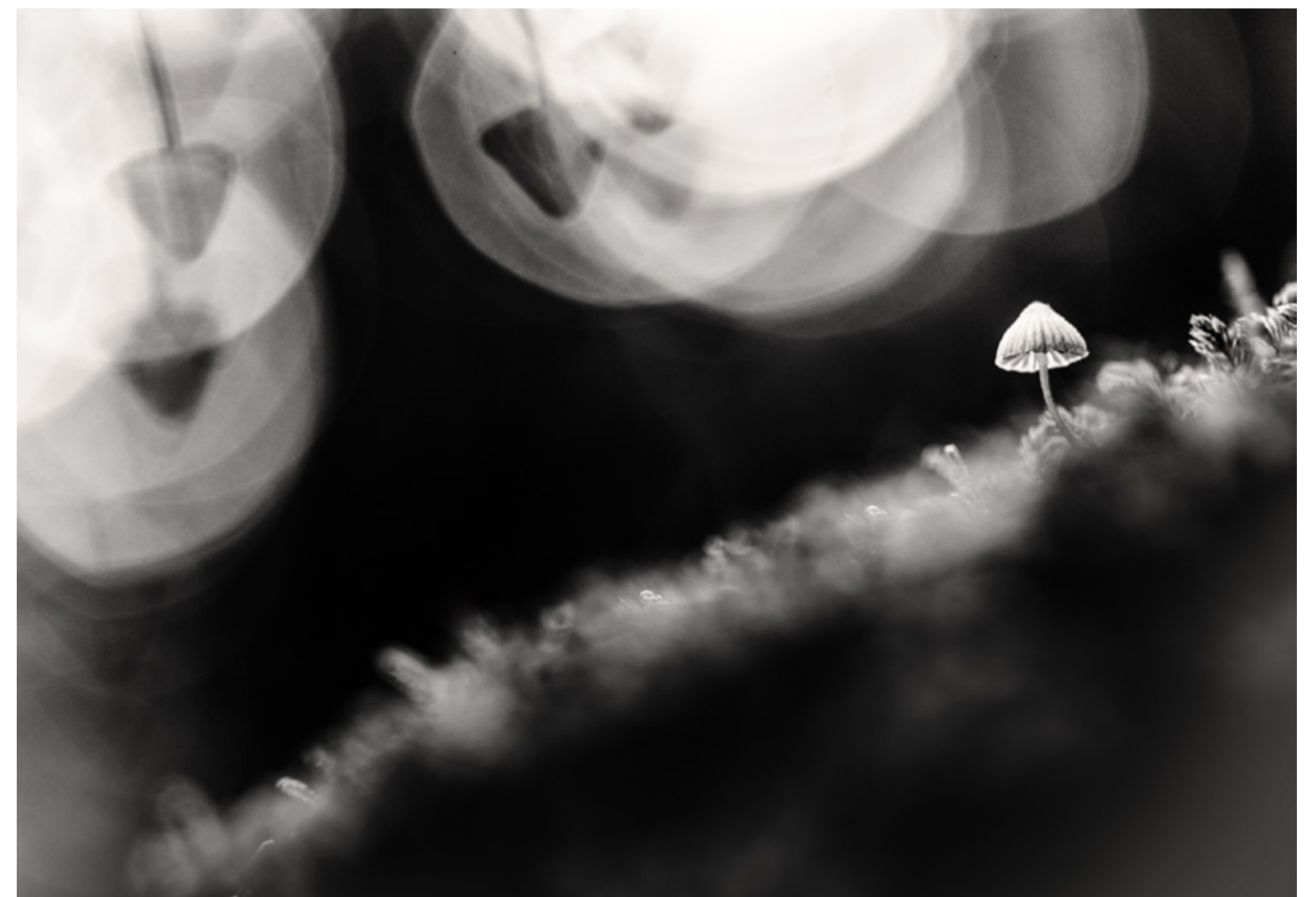
1er prix Noir et Blanc : Mycène Hallucinogène de Alain Limanton 60 pts/60 - 100 iso f 4 1/60 s