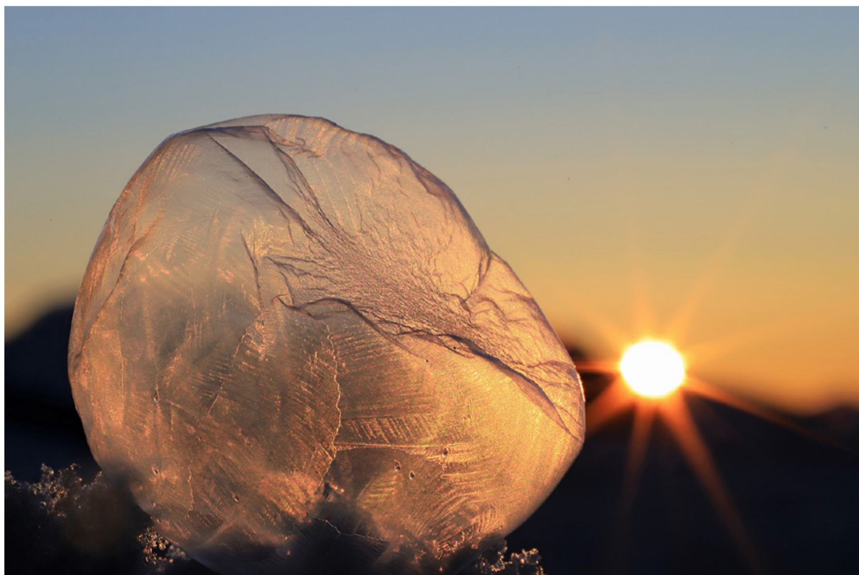
Mémoire éphémère d'un Phylactère n°5 de Christian Dupont - 800 iso f 32 1/400 s