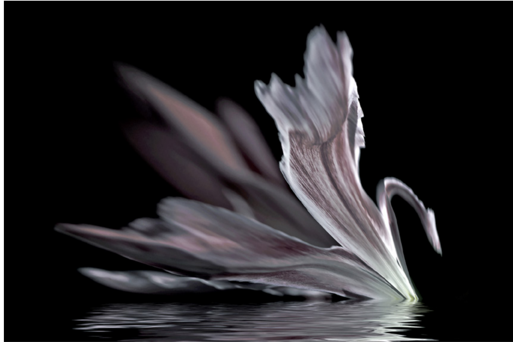
Le cygne - Benedict Savary

Elle concerne tout sujet observé à l'échelle du minuscule.