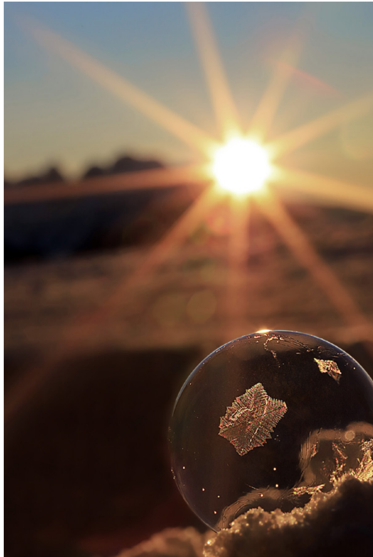
Mémoire éphémère d'un Phylactère n°1 de Christian Dupont - 800 iso f 32 1/160 s