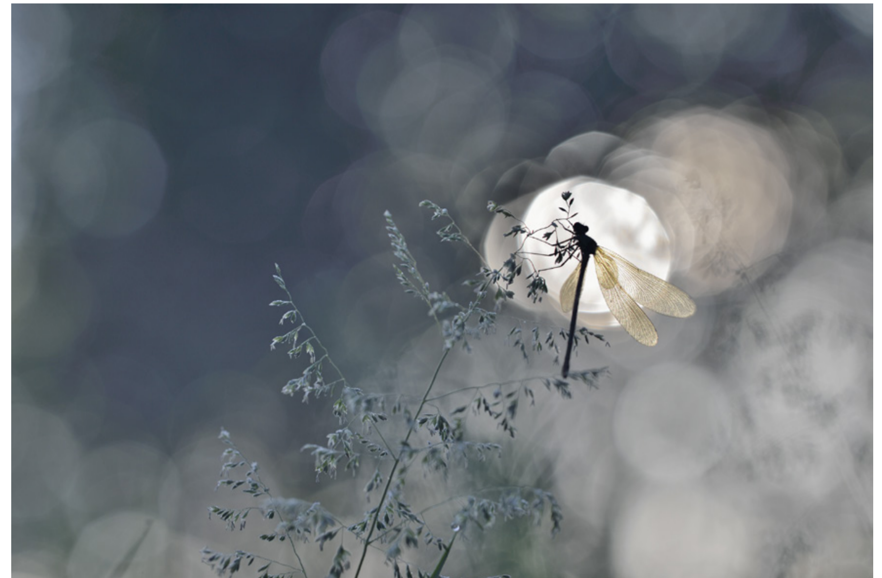
1er prix Couleur : Sous les étoiles de Pascal Vivi 58 pts/60 - 100 iso f 2.8 1/800 s

Coup de cœur du juge Benjamine Scalvenzi Au pays des schtroumpfs où tout est merveilleux de Pascal Vivi