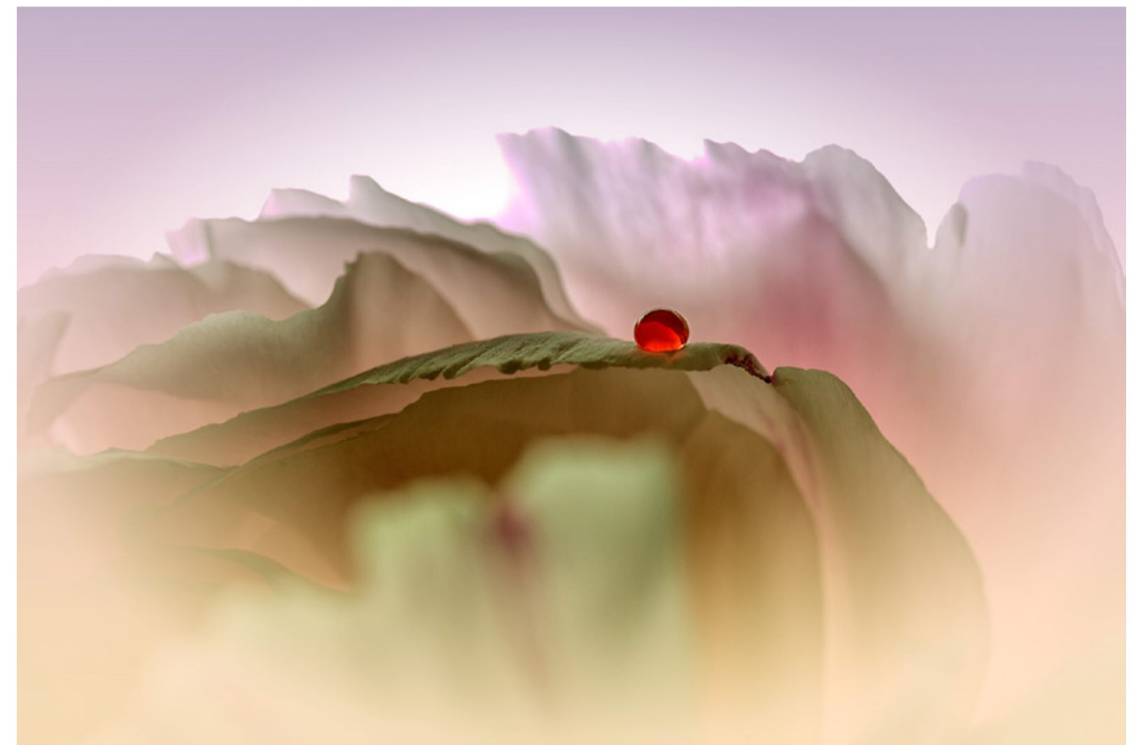
Rubis - Benedict Savary