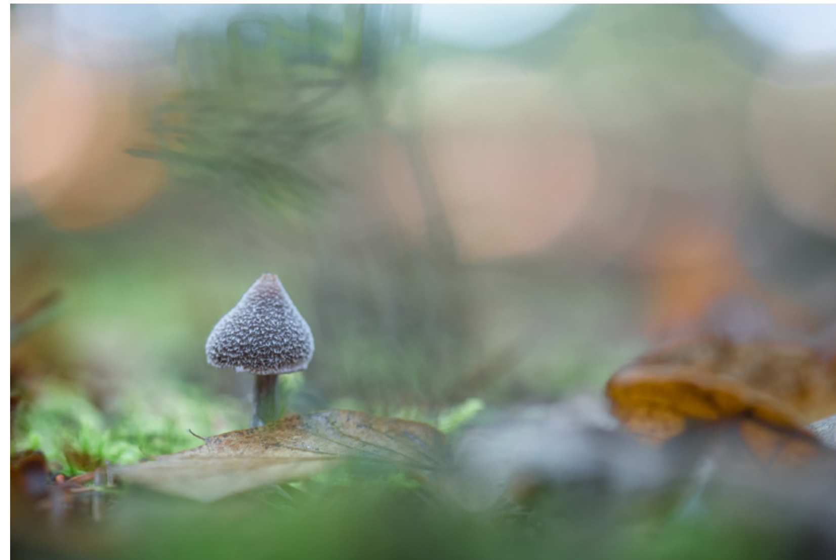
Coup de coeur du juge Christophe Aubert - Cortinaire poilu de Alain Limanton 400 iso f 4 1/60 s