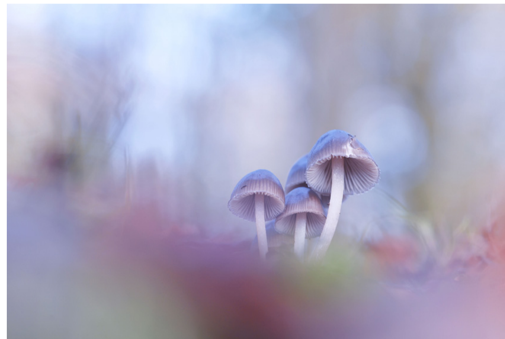
Coup de coeur du juge Benjamine Scalvenzi - Au pays des Schtroumpfs où tout est merveilleux de Pascal Vivi - 400 iso f 6,3 1/60 s